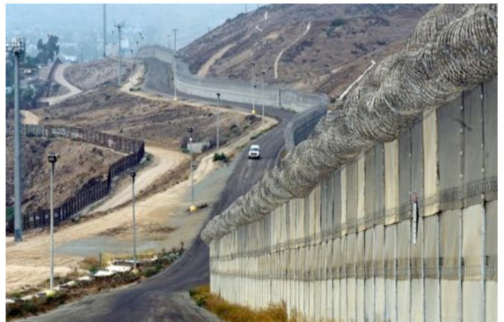
Die Nord/Süd-Grenze zwischen Mexiko und den Vereinigten Staaten bei Nogales und im "Niemandland"